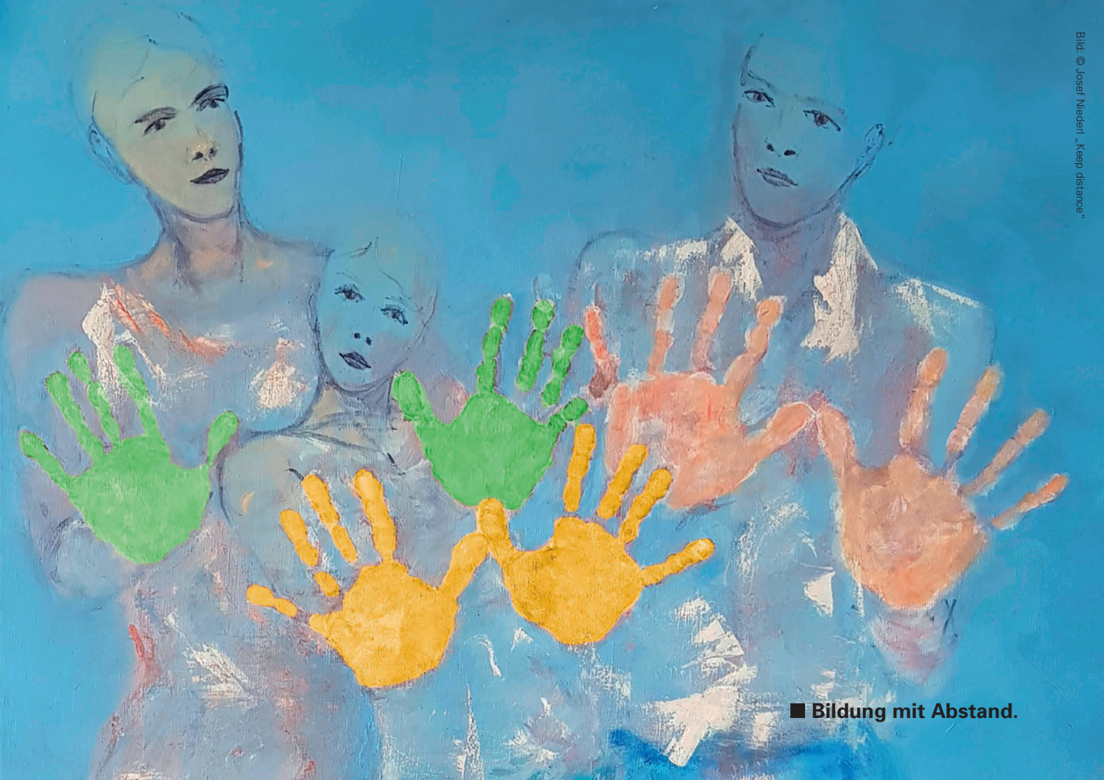
■ Bildung mit Abstand.